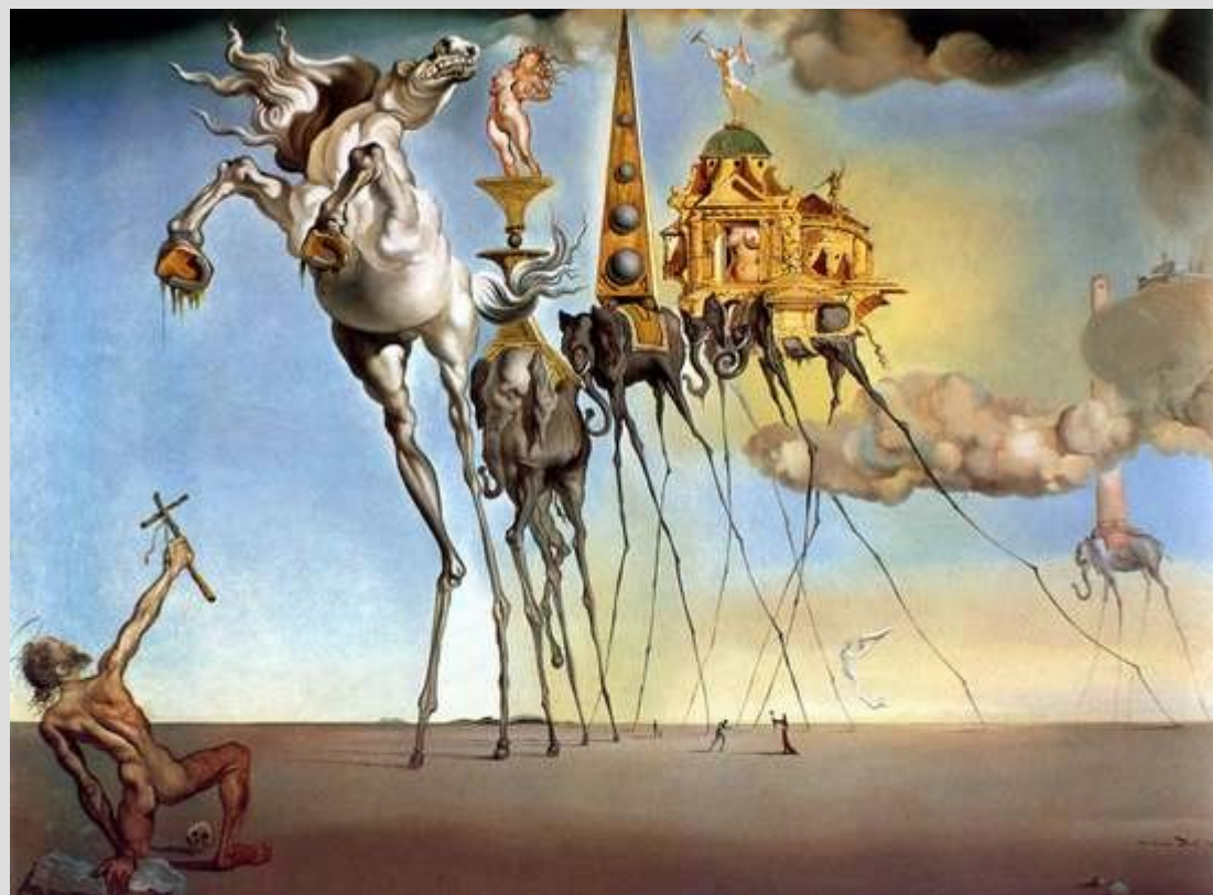
[S. Dalí – The temptation of St. Anthony, 1946]